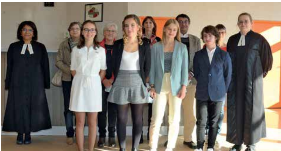
Culte de Confirmation le 18 octobre à la salle socioculturelle de Goxwiller.