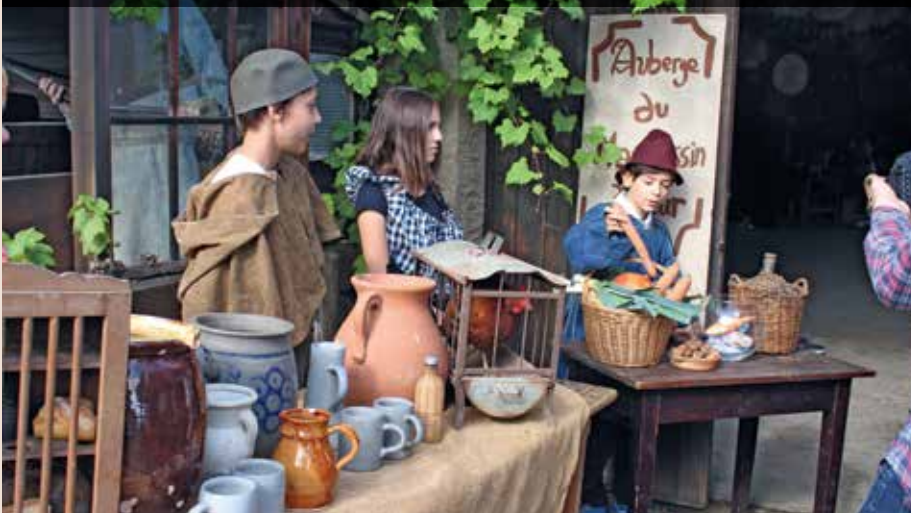
Lorsqu'une rue de Mittelbergheim se transforme en rue marchande au Moyen-Âge.