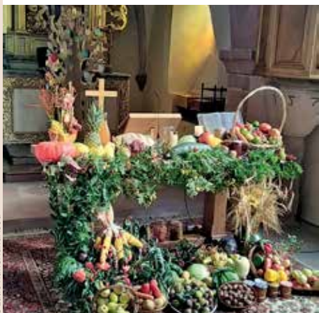
Culte des Récoltes le 11 octobre. Nous rendons grâce au Seigneur pour tous ses dons. Ils ont été offerts à l'Épicerie sociale Obern'aide.