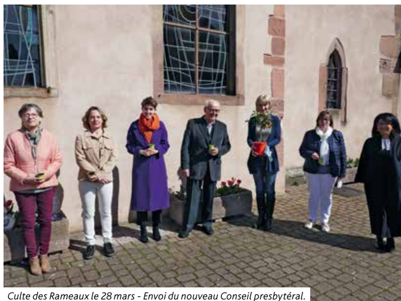
Culte des Rameaux le 28 mars - Envoi du nouveau Conseil presbytéral.

Que le Seigneur les bénisse dans cette nouvelle aventure.