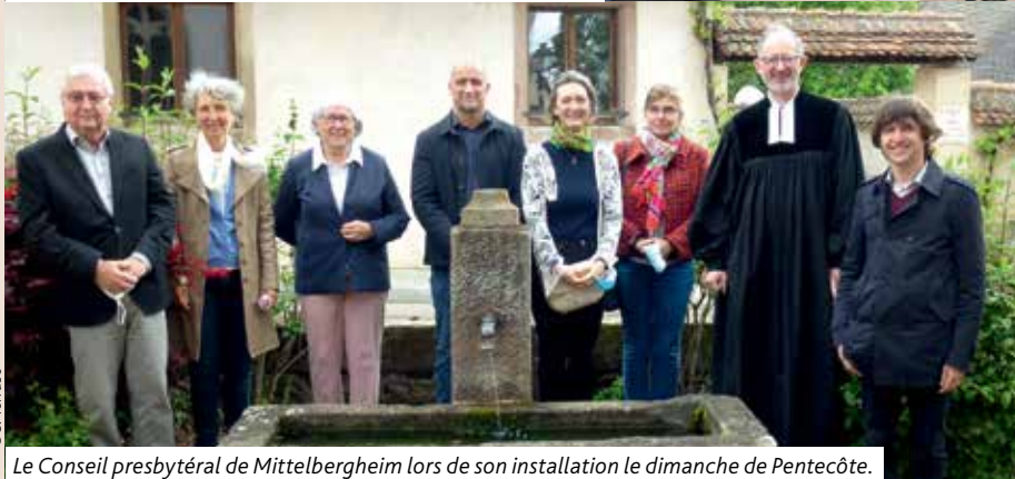
Le Conseil presbytéral de Mittelbergheim lors de son installation le dimanche de Pentecôte.