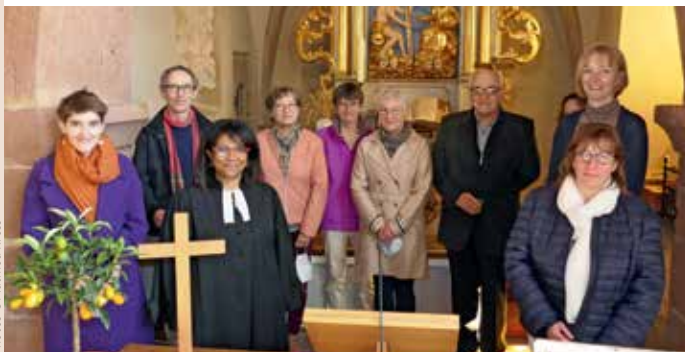
Culte de Rameaux le 28 mars - « Passage de témoin » entre le nouveau Conseil et les conseillers sortants.