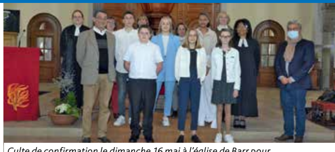
Culte de confirmation le dimanche 16 mai à l'église de Barr pour les confirmands de Klingenthal-Obernai et Goxwiller-Bourgheim.