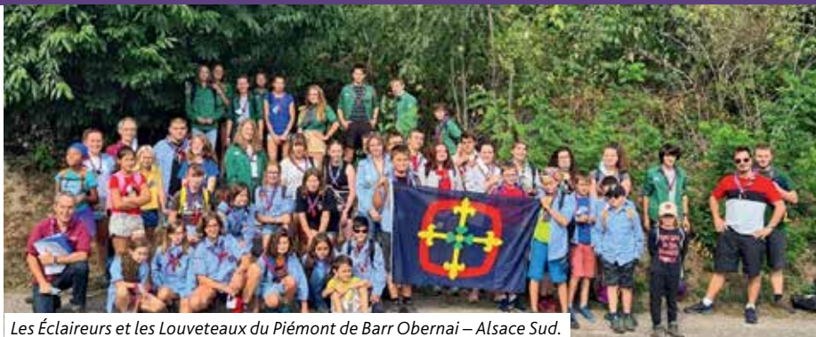
Les Éclaireurs et les Louveteaux du Piémont de Barr Obernai – Alsace Sud.