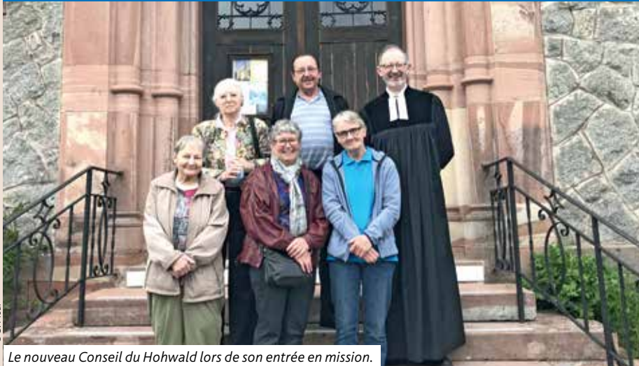
Le nouveau Conseil du Hohwald lors de son entrée en mission.