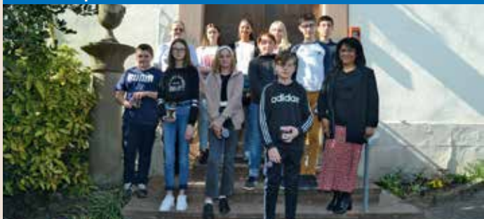
Culte de présentation des confirmands le 24 avril à Klingenthal.