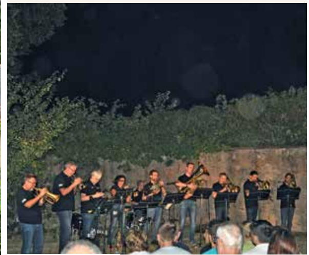
Le concert de l'été 2019.

Le stage de cuivres de Mittelbergheim accueille des instrumentistes (trompettes, cors, trombones, tubas/euphoniums) de tous niveaux et de différents horizons désirant se perfectionner dans la pratique de leur instrument, jouer avec d'autres musiciens en petits ensembles ou tout simplement se faire plaisir !