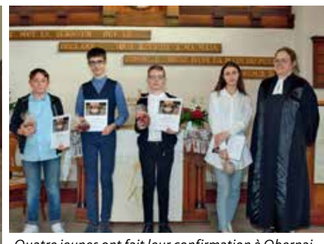
Quatre jeunes ont fait leur confirmation à Obernai le 23 mai.