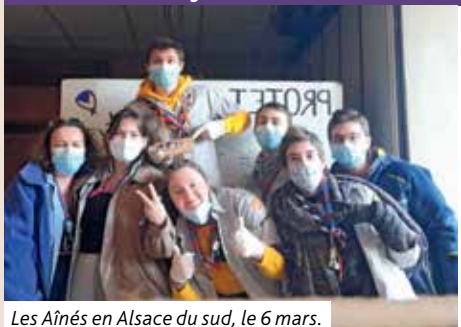
Les Aînés en Alsace du sud, le 6 mars.