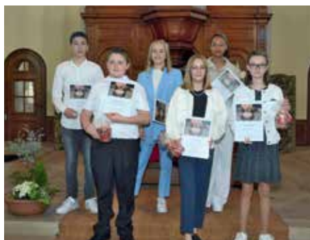
Six jeunes ont fait leur confirmation à Barr le 16 mai.