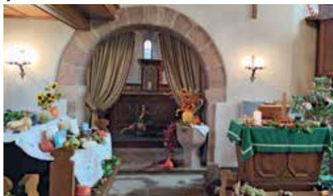
Culte des récoltes le 3 octobre. Merci pour tous vos dons et votre souci de l'autre. Comme chaque année, ils ont été offerts à l'Épicerie sociale Obern'aide.