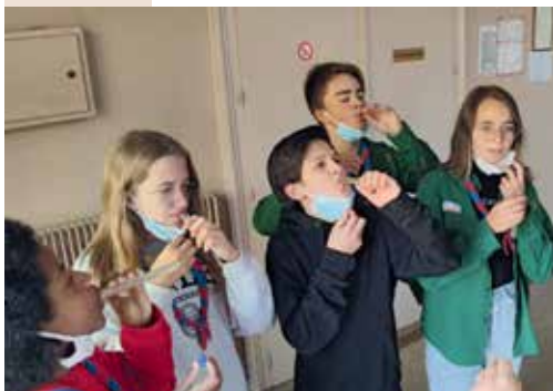
Après-midi Escape Game avec les jeunes du consistoire.