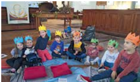
Rois et reines pour protéger le beau jardin de la Création.

Prochaine date : samedi 11 décembre à 16h à Barr (ouvert à tous).