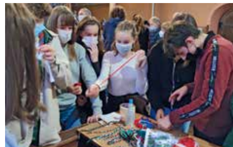
Culte FESTI'FOI « En route vers une Église verte » les chants et les 5 ateliers animés par les jeunes du consistoire, chacune et chacun a mis la main à la pâte.