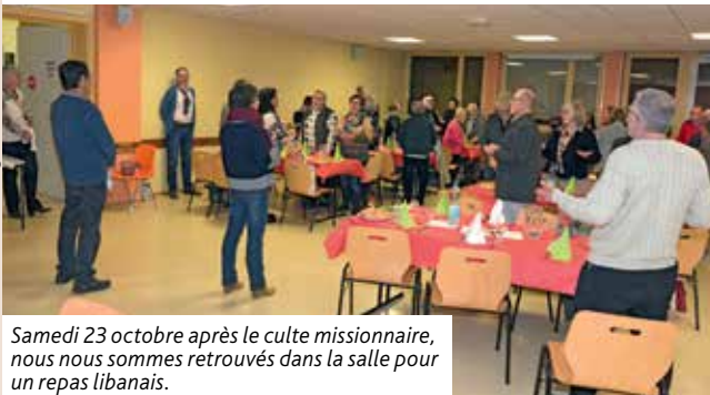
Samedi 23 octobre après le culte missionnaire, nous nous sommes retrouvés dans la salle pour un repas libanais.