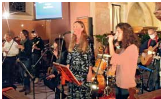
Soirée de louange animée par le groupe de louange senior du consistoire.