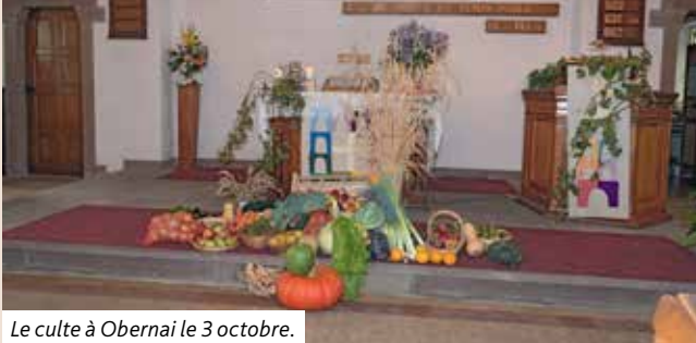
Le culte à Obernai le 3 octobre.