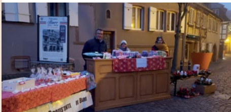
Vente des couronnes de l'Avent sur le marché de Barr, le 30 novembre.