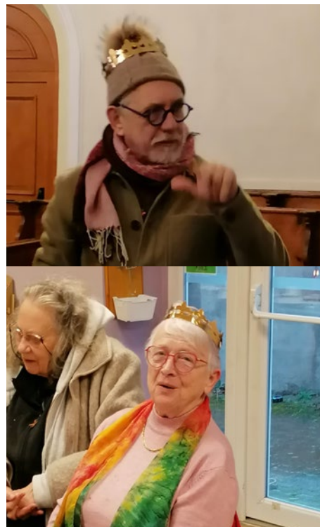
Les aînés de la paroisse de Heiligenstein ont tiré les rois le jeudi 9 janvier après-midi dans la salle paroissiale.