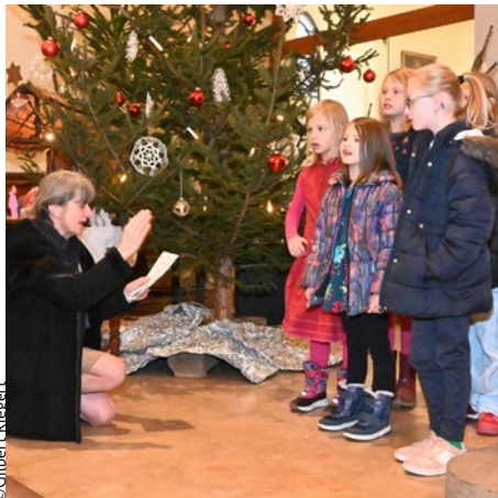
Culte commun de la fête de Noël des enfants à Heiligenstein, le 22 décembre.