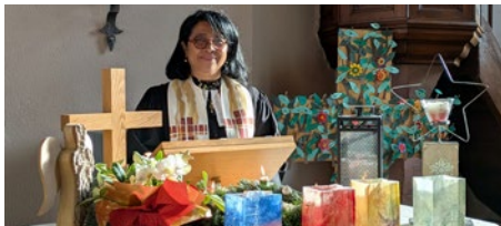
Toute ma reconnaissance au Seigneur pour ce 10 ème Noël à Goxwiller-Bourgheim.