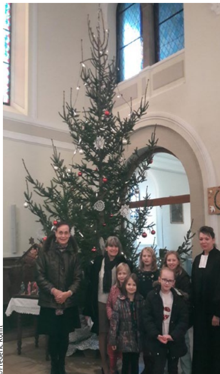
Fête de Noël des enfants le dimanche 22 décembre à Heiligenstein.