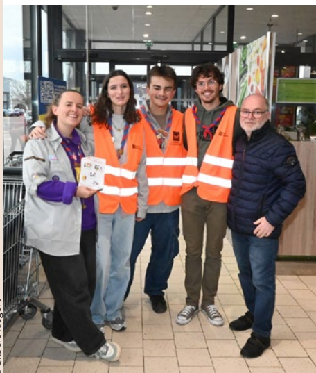
Collecte au Lidl, le 23 novembre.