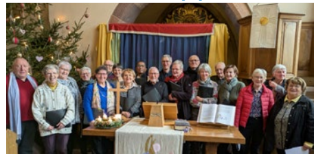
Moment béni de louange avec la chorale !