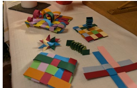
La créativité naît du partage et des rencontres.