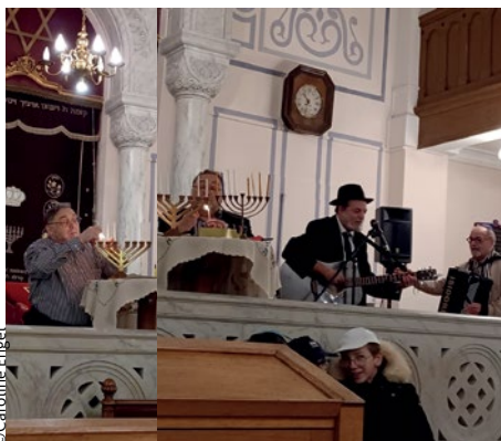
Fête de Hanouka le 1 er janvier.