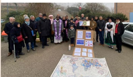
Moment interreligieux pour la Paix, sur le parvis de l'église le 1 er décembre.