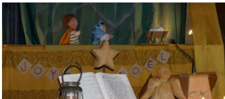
L'histoire de Noël « L'enfant emmailloté » racontée par Graines de Bible avec les marionnettes créées par Helga Dietlé.