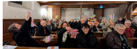
Quelle grâce de pouvoir tisser des liens de fraternité toujours et encore !