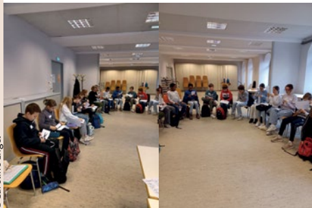
Rencontre de nos catéchumènes de 1 ère année avec les jeunes catholiques d'Obernai et environs, le 16 novembre.