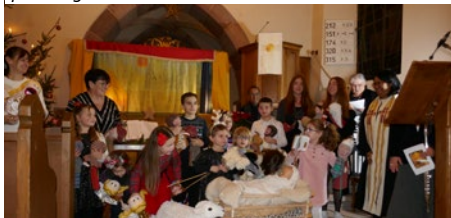
La joie de Noël dans nos coeurs.