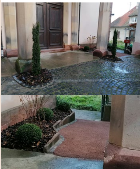
Les travaux d'aménagement du parvis de l'église de Heiligenstein ont été réalisés en fin d'année 2024.